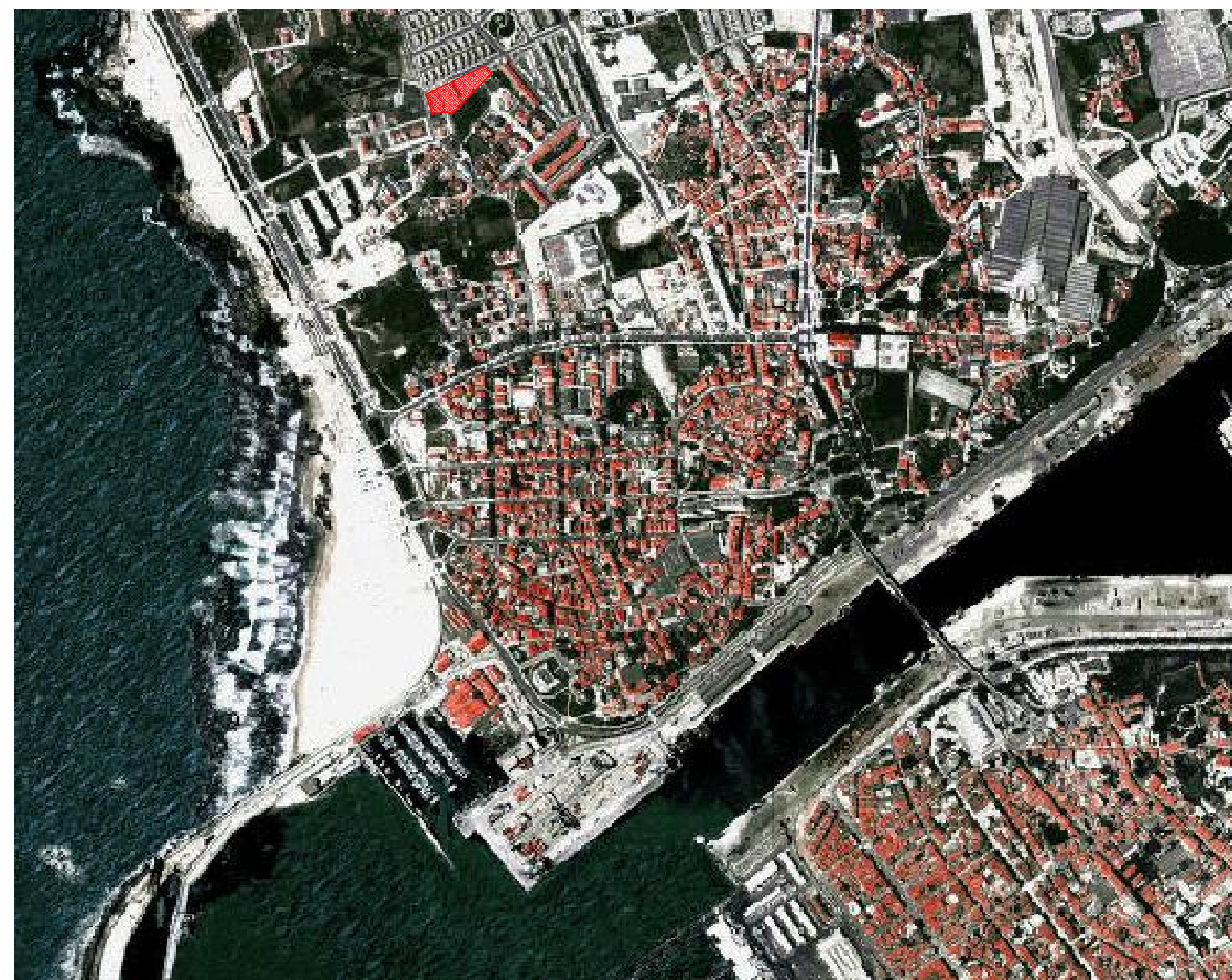
LOCALIZAÇÃO - FOTOGRAFIA AÉREA