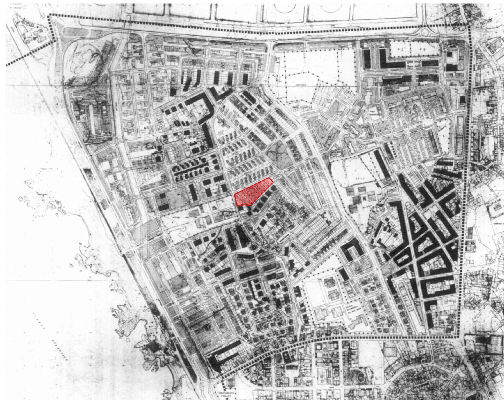
LOCALIZAÇÃO - PLANO DE PORMENOR